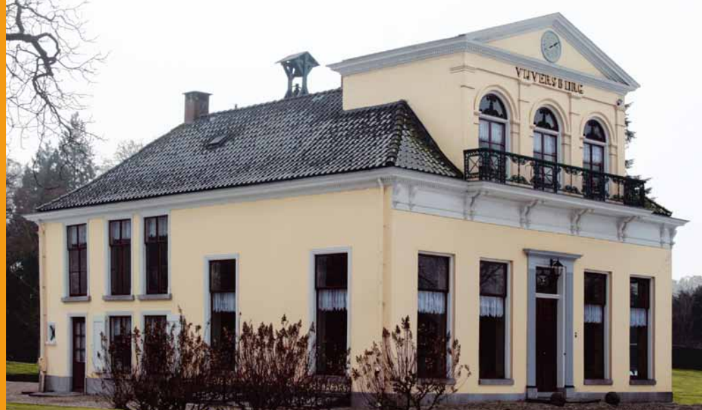
Vijversburg te Tietsjerk

Redactie Nieuwsbrief: Franke Doting, Rita Mulder-Radetzky, Peter Nieuwenhuijsen en Frouke Feijen (BYLD)