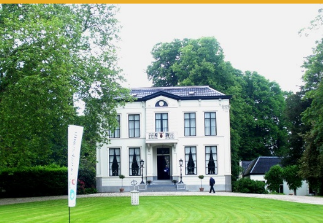
Klein Jagtlust is één van de locaties van het Oranjewoudfestival