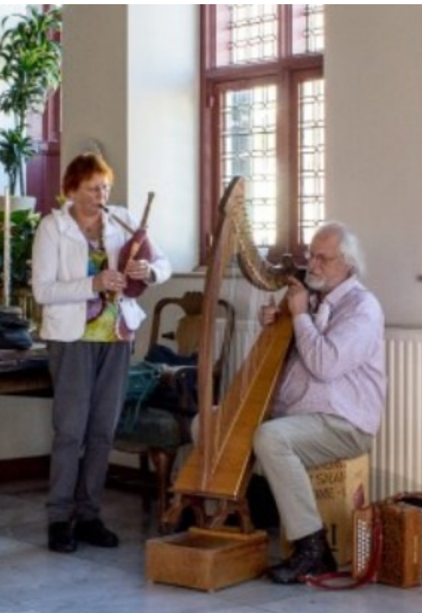
Het duo Katmarfolk zal dit jaar meer dan eens voor livemuziek zorgen op Dekemastate